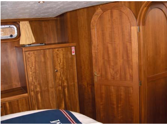
9903336 Jacabo 12.25 "For pleasure"