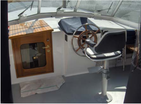
9903336 Jacabo 12.25 "For pleasure"