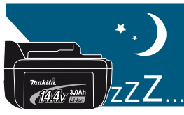
Langdurige opslag mogelijk, lage zelfontlading