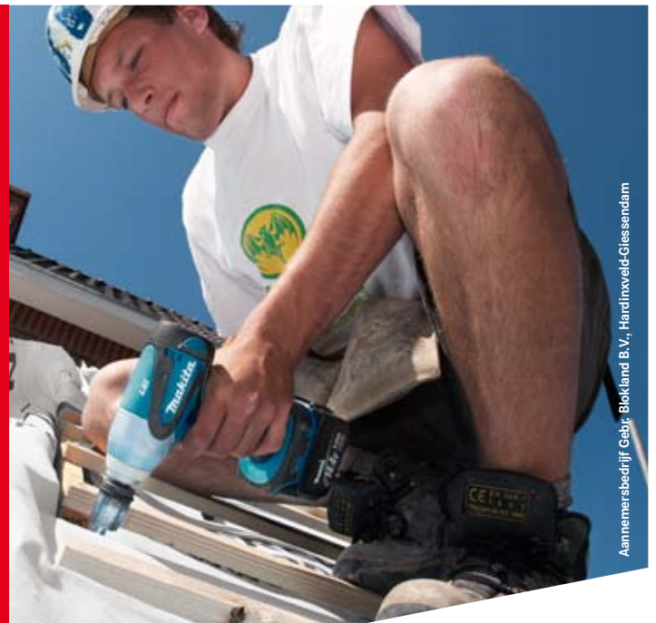
Annamerbedrijf Gebr. Blokland B.V., Hardinveldt-Giesendam

MEER ACCUTECHNOLOGIE MEER BALANS MEER GEBRUIKSGEMAK MINDER LAADTIJD MINDER BETALEN: €30,- INRUILPREMIE