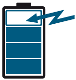
Bijladen mag, geen geheugen effect

Doordat Lithium-ion accu's geen memory effect hebben en de Makita opladers zijn ontworpen om de levensduur van de accu te verlengen wordt het zelfs aangeraden om zoveel mogelijk op te laden. Hierdoor heeft het aantal laadcycli als een methode om de levensduur te bepalen geen betekenis meer. Er is maar één index die correct weergeeft wat de levensduur van een accu is, en dat is het werkvolume per levensduur van de accu. Het werkvolume per levensduur van een Makita Lithium-ion accu is 3,3 keer dat van de Makita Ni-MH.