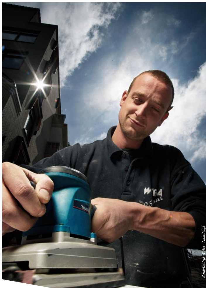
Bouwbedrijf Weba - Naaldwijk