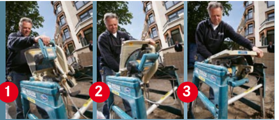
In 3 stappen van afkortzaag naar tafelzaag: